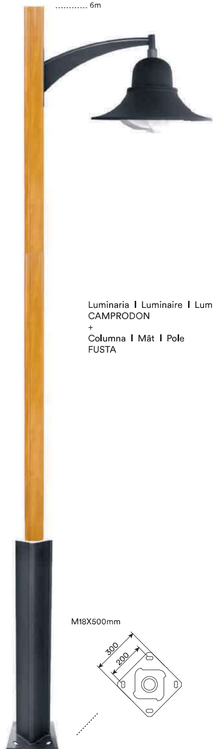
Luminaria | Luminaire | Luminaire CAMPRODON + Columna | Mât | Pole FUSTA