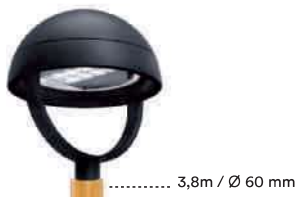
Luminaria | Luminaire | Luminaire GLOBUS + Columna | Mât | Pole FUSTA